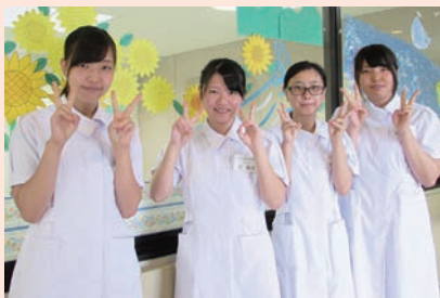
ふれあい看護体験参加者

参加者は、病棟業務の体験や院内見学等を行い、患者さんとも触れ合っていたできました。患者さんも、学生と接することが出来てとても嬉しそうでした。