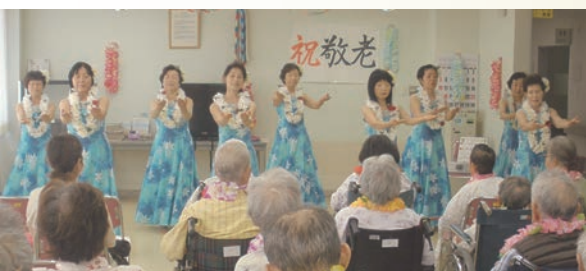
ダンスを披露する「レイ・プルメリア」の皆さん