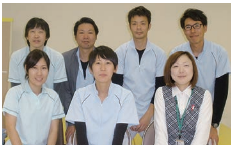
リハビリテーション科スタッフ一同

また、心肺機能や嚥下機能、言語機能など生活に必要な各種機能の回復を促すこともリハビリの役割であり、これらの治療も組み合わせ